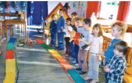
Sie erbauen die Stadt Jerusalem und durften dem Jesus zujubeln, als dieser vor mehr als 2000 Jahren auf dem Esel in die Stadt eingezogen ist.