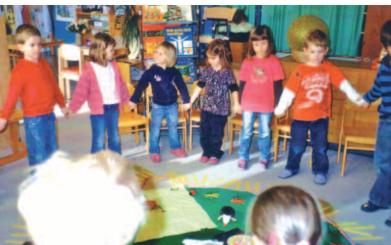
Eine traurige Geschichte, die aber ihren Höhepunkt in der Freude der Auferstehung findet.

So feierten die Kleinen voll Freude und Interesse das „Neue Leben“ von Jesus und das Erwachen der Natur.